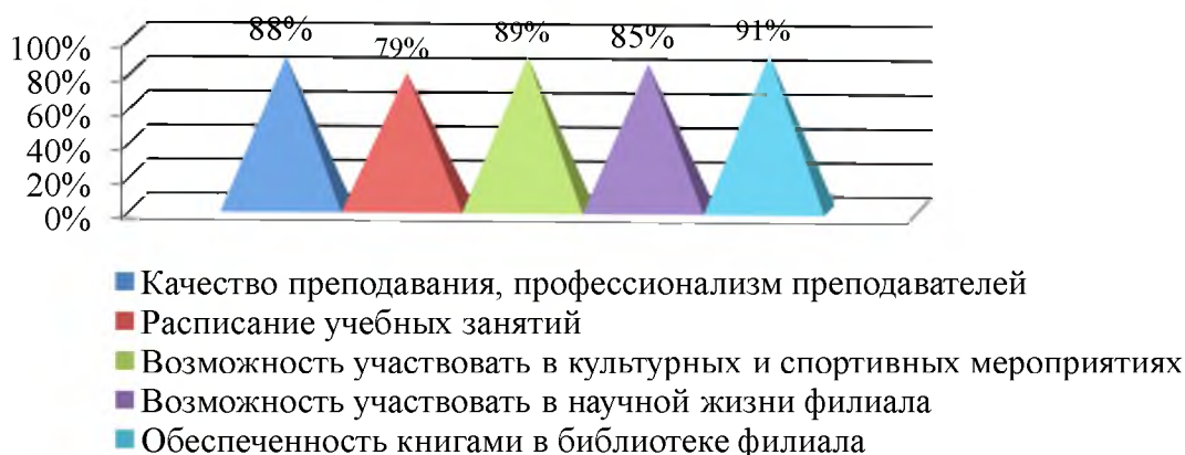
Рисунок 2 – Степень удовлетворённости образовательной деятельностью филиала

В целом, образовательной деятельностью филиала удовлетворены полностью или частично практически все родители, по разным направлениям от 79 до 91% родителей студентов. Результаты в процентах представлены на рисунке 2.